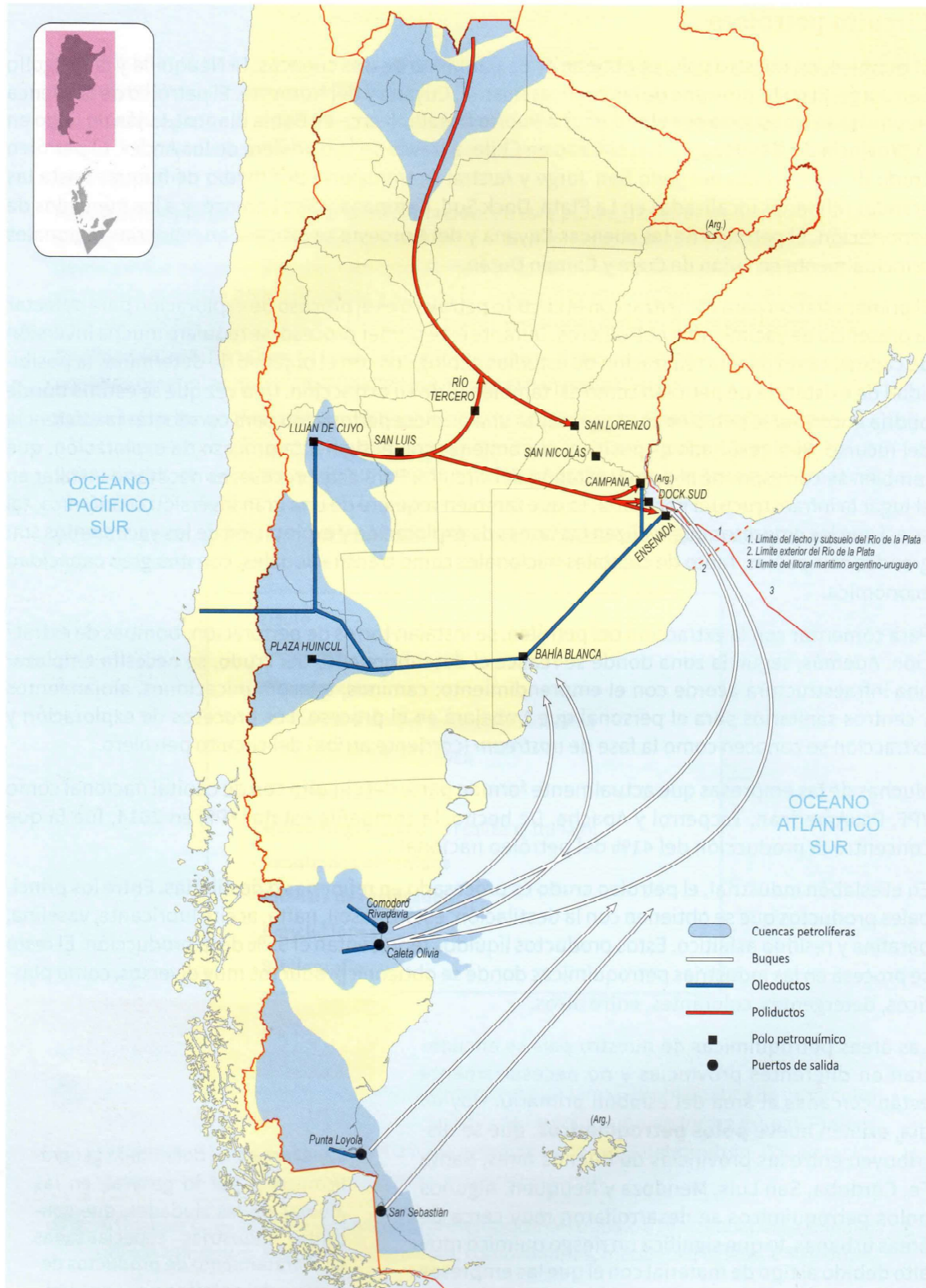
Cuencas petroleras argentinas actualmente en explotación, canales de transporte existentes tanto para el petróleo crudo como sus derivados y provincias que cuentan con polos petroquímicos