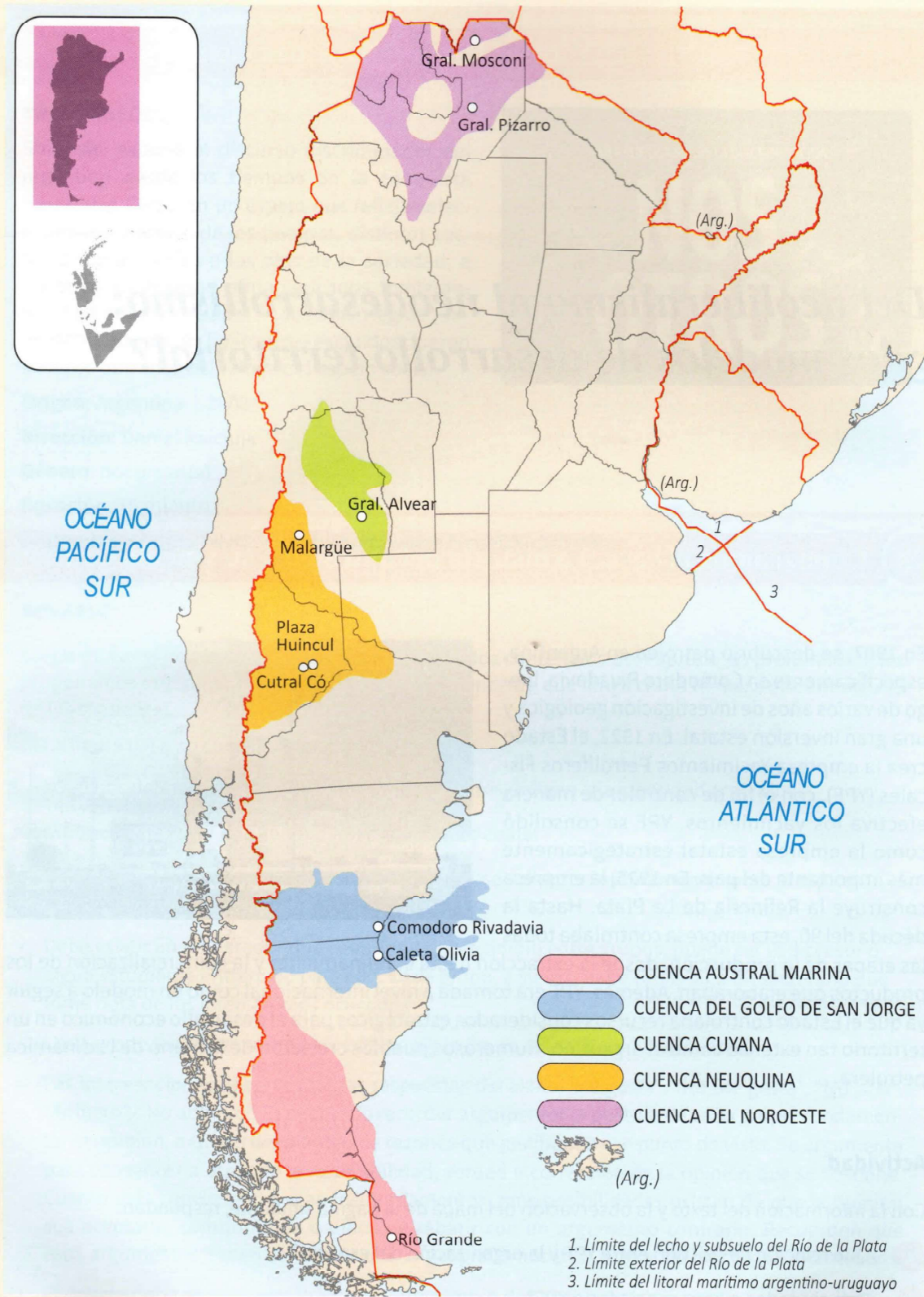
Cuencas petrolíferas de Argentina