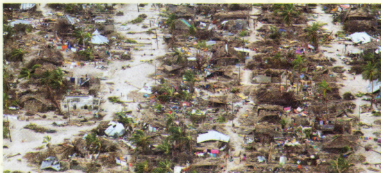
El paso del huracán Kenneth por Mozambique