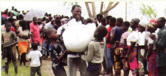
Ayuda humanitaria en Mozambique

Estos eventos meteorológicos de gran intensidad se relacionan con la cálida temperatura de la superficie del agua del océano Índico, aumentando así, la formación de tormentas de mayor intensidad. Este escenario incrementa el riesgo de una comunidad ya vulnerable, con escasos recursos para recuperarse de estos desastres ambientales, dependiendo de la ayuda externa de organizaciones como la Cruz Roja o las Naciones Unidas.