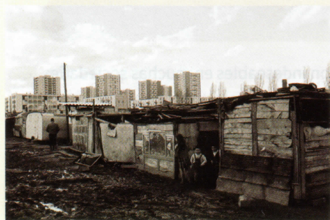
Bidonville argelino de Nanterre, Francia (1966). Los bidonvilles son asentamientos precarios similares a las villas en Argentina o las favelas en Brasil

Dentro de estos guetos que acabamos de mencionar, los edificios suelen ser antiguos en viviendas pequeñas, en las que uno de los principales problemas es el hacinamiento, es decir, que en cada habitación de la vivienda viven y duermen tres o más personas. Además, los franceses tienen prioridad al momento de acceder a la vivienda social: solo un 6,5% de las mismas son destinadas a