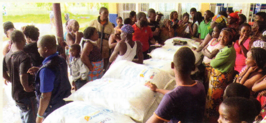
Refugiados en una escuela, distribución de comida para quienes quedaron sin viviendas