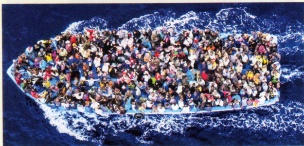
Las pateras son botes precarios que atestados de inmigrantes cruzan los mares para llegar a Europa

Según datos de la Oficina de las Naciones Unidas contra la Droga y el Delito (UNODC), se estima que cada año 55.000 migrantes son objeto de tráfico "ilícito" de África oriental, septentrional y occidental a Europa y producen un ingreso cercano a los 150 millones de dólares para los que organizan las travesías. Los migrantes realizan largos trayectos por zonas desérticas y mares tempestuosos, que ocasionan decesos en muchos de los casos: entre 1996 y 2011, como mínimo 1691 personas perdieron la vida en viajes por el desierto y, en 2008, se produjeron 1000 muertes en los viajes en embarcaciones precarias (pateras) y barcos por el mar Mediterráneo o el Océano Atlántico.