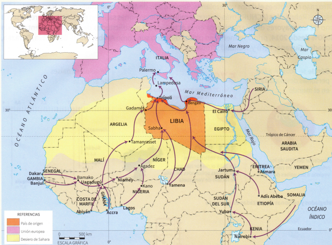
Rutas migratorias a través de Libia