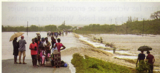
Las inundaciones provocadas por el huracán Kenneth