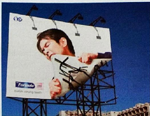
Ejemplo de publicidad ATL