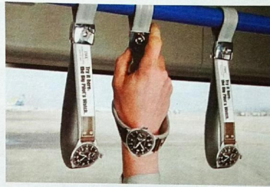
Ejemplo de publicidad BTL

del líquido que contiene, una estatua viviente, una alcantarilla), una feria, el merchandising , eventos, promociones y marketing directo, publicidad viral (de la cual hablaremos más adelante), entre otros. Su objetivo es la promoción de productos, servicios o ideas mediante acciones, en cuya concepción se emplean altas dosis de creatividad, sorpresa y sentido de la oportunidad, creándose novedosos canales para comunicar mensajes publicitarios. Es un tipo de publicidad centrada totalmente en el cliente, atiende a una multiplicidad de estímulos y es, a la vez, interna y sutil.