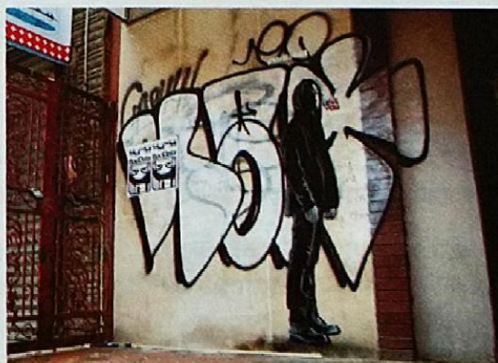
Grafiti de la campaña de publicidad viral del lanzamiento de la serie televisiva Mr. Robot (Nueva York, EE. UU.)

Turco, Bucky (2015). “Don’t be fooled by this fake street art. It’s actually guerrilla advertising for a TV show”. En Animal , 14 de julio.