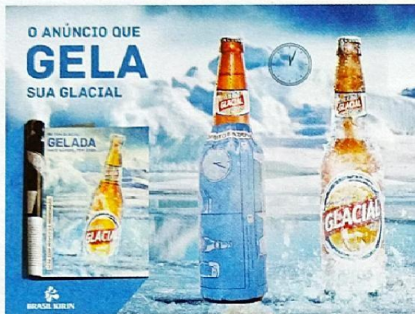
El anuncio que congela su cerveza Glacial