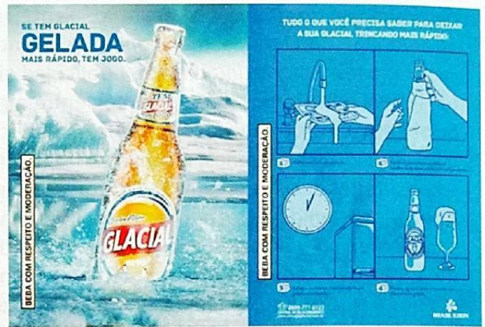
Procedimiento para transformar la página de la revista en un dispositivo congelador de cerveza