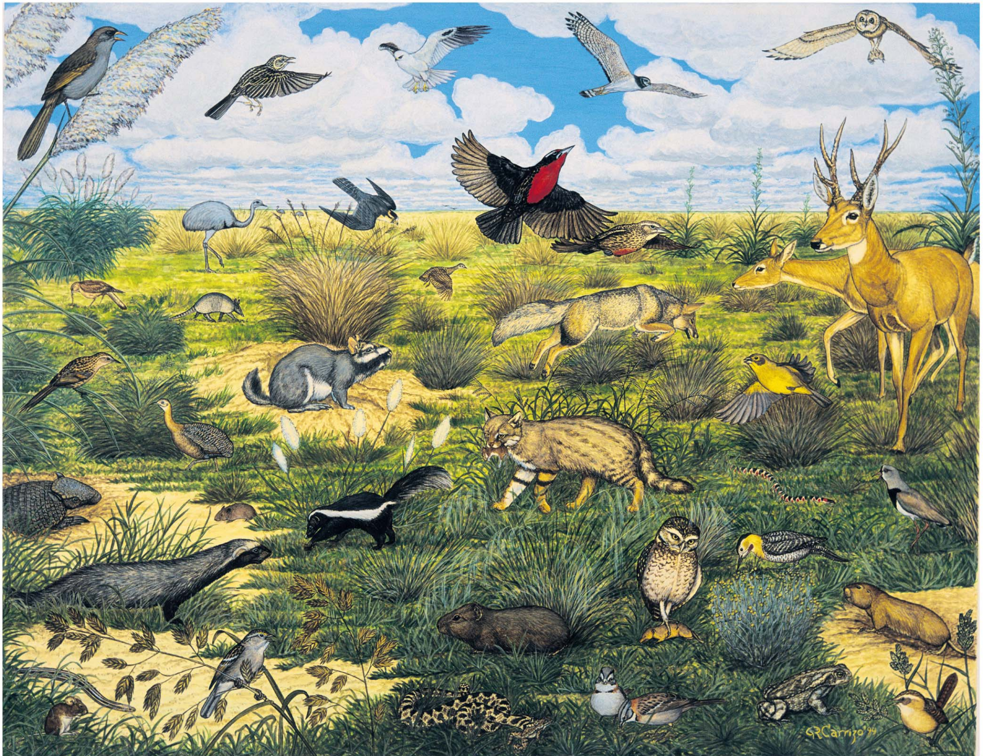
EL PASTIZAL PAMPEANO