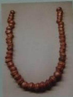
◀ Collar de bronce del Neolítico, Museo Histórico de Berna.

más resistentes, como el bronce (una aleación de cobre y estaño) y el hierro. Este último metal comenzó a ser usado hacia el año 1500 a. C. solo por algunos pueblos.