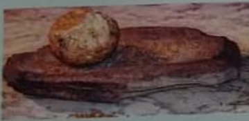
▲ Mortero de piedra.

La piedra se frotaba hasta darle forma y sacarle filo. Así se lograron armas más eficaces y nuevas herramientas. Debido a la importancia de la agricultura, se fabricaron morteros, para moler los granos; hoces, que se creaban al incrustar hojas de sílex en piezas de madera o en cuernos; azadas, formadas por un hacha de piedra con un mango resistente, y palas de hueso o cuernos de animales.