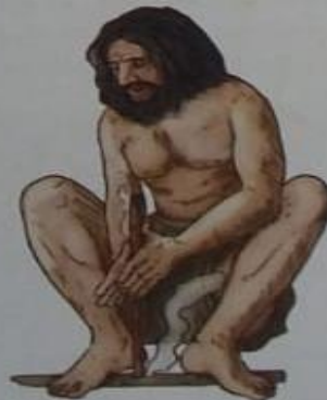
▲ Frotar dos trozos de madera es una forma de hacer fuego por calentamiento del material.