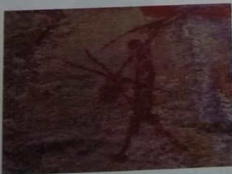
▲ Pintura sobre roca de un cazador con sus armas. Chapada Diamantina, sierra Isabel Dias, Brasil.