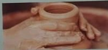
▲ El uso del torno sirvió para perfeccionar la técnica de la cerámica.

Esta técnica comenzó hacia el año 6000 a. C., en las actuales Turquía, Siria, Irak e Irán. El primer método, llamado modelado , consistía en aplastar rollos de arcilla hasta alcanzar una pieza de la altura deseada. Más tarde, la invención del torno permitió variar las formas de las vasijas y hacerlas de paredes más delgadas.