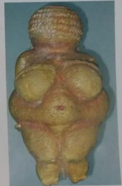
▲ Venus de Willendorf. Estatuilla descubierta cerca de la localidad austríaca de Willendorf, en 1908. Está tallada en piedra caliza y mide 11,7 cm de alto. Fue realizada entre los años 28.000 y 25.000 a. C. Museo de Historia Natural, Viena.

¿Qué prácticas cambiaron los seres humanos durante el Paleolítico? ¿Qué consecuencias creen que pudieron haber tenido en su forma de vida?