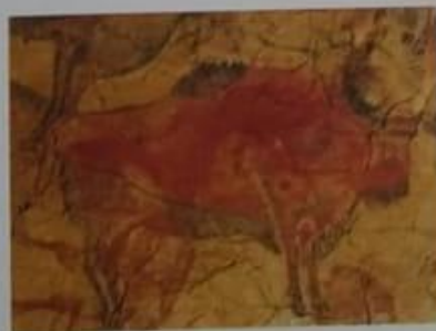
▲ Bisonte pintado en el interior de la cueva de Altamira, en el norte de España.

ciones se hallaron en todos los continentes donde vivió el Homo sapiens . ●