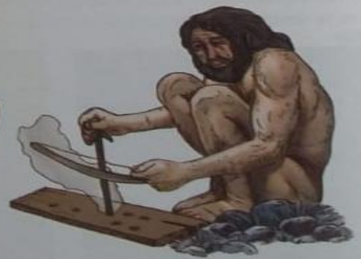
▲ Este instrumento, más elaborado, funciona al hacer girar rápidamente una varilla sobre una pieza de madera blanda y seca.