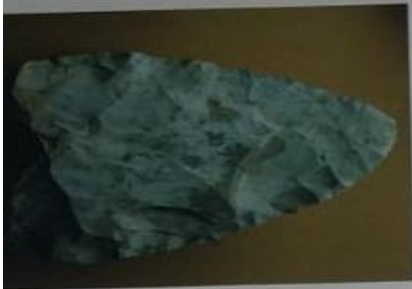
▲ Punta de piedra de doble hoja del Paleolítico, obtenida mediante la técnica de presión.