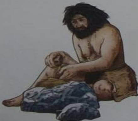
▲ Al frotar una piedra de sílex con una pirita de hierro, se producen chispas, que permiten encender ramas y hojas.

Aunque no se sabe con precisión cuándo se logró hacer fuego, es seguro que el Homo erectus lo utilizaba. Tal vez este grupo humano se limitaba a tomar ramas encendidas por la caída de un rayo o por los ríos de lava. Más tarde, gracias a su conocimiento de la naturaleza y de los beneficios que obtenían del fuego, los Homo sapiens desarrollaron diversas técnicas para encenderlo .