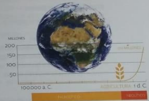
▲ Aumento de la población (en millones) en relación con el desarrollo de la agricultura.

Se estima que, hace un millón de años, en el planeta vivían 125.000 seres humanos, todos en el continente africano. A fines del Paleolítico, la población ya alcanzaba los cinco millones de habitantes y se encontraba distribuida en todos los continentes. El crecimiento se aceleró durante el Neolítico, debido a la mayor producción de alimentos. En el año 5000 a. C., la población mundial ya había alcanzado los 80 millones de habitantes, y esa cifra treparía a 250 millones en el primer año de nuestra era.