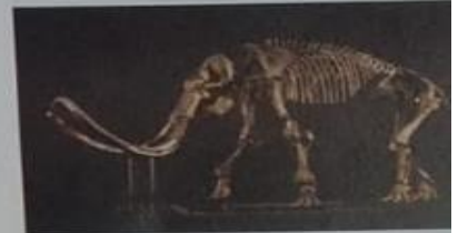
▲ Los mamuts eran mamíferos de la familia de los elefantes actuales y tenían dimensiones similares a las de estos. Se extinguieron hace unos 37000 años.