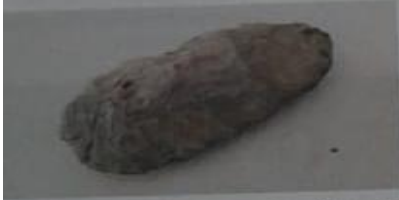
▲ Cuchillo de piedra del Paleolítico elaborado por medio de la técnica de percusión.