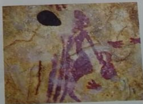
▲ Pintura sobre roca de una mujer que recolecta miel. Cueva de la Araña, Valencia, España.