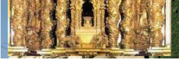
COLUMNA SALOMONICA O COLUMNA TORSA

En las diversas artes la columna salomónica , torsa o entorchada es una columna con fuste de forma helicoidal, que se utilizó fundamentalmente en Europa y en América en la arquitectura barroca. Recibe su nombre por la creencia de la época en que así fueron las columnas del Templo de Salomón .